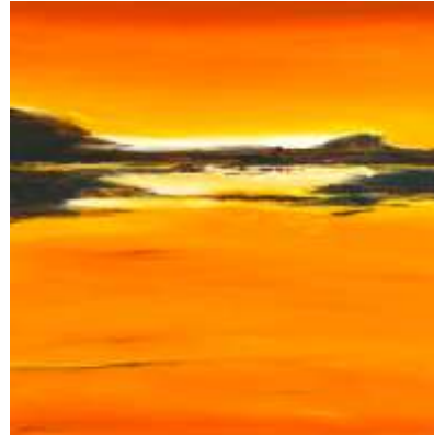
Greet Steenland – At the lake

Whistler beoogde een atmosferisch effect en verfijnde harmonieën van kleur en tonaliteit. In zijn Venetiaanse periode schilderde hij bovendien uitsluitend monochromen. Dezelfde doelen die Greet Steenland, beeldend kunstenaar van nu, nastreeft.