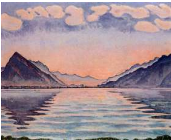
Ferdinand Hodler – Lake Thun