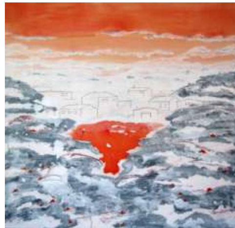
Myra de Vries – White village

In haar doeken vinden we bovendien eenzelfde voorliefde voor symmetrie, een licht palet en geometrische vormen die het latere werk van Hodler kenmerken. En ook de creatie van een allesomvattende harmonie verbindt de 19 e -eeuwer Hodler met de 21 e -eeuwse Myra de Vries.