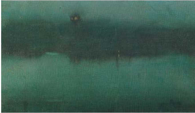
James Whistler – Nocturne grijs en zilver

gemaakt voor wie Turner en in het bijzonder zijn reeks werken over Londen een belangrijke inspiratiebron was. James Whistler schilderde zijn eerste 'maanlicht boven de Theems'-schilderijen in 1872. Vooral zijn Nocturnes werden door de Duitse criticus Richard Muther 'landschappen van de geest genoemd, zacht over het oppervlak uitgedemd en door geheimen omgeven' 2 .